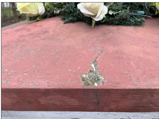
Fot. nr 26. Łochów, Al. Węgrowska, figura św. Jana Nepomucena I poł. XIX w., fragment, str. wsch., stan przed konserwacją, listopad 2022 r.