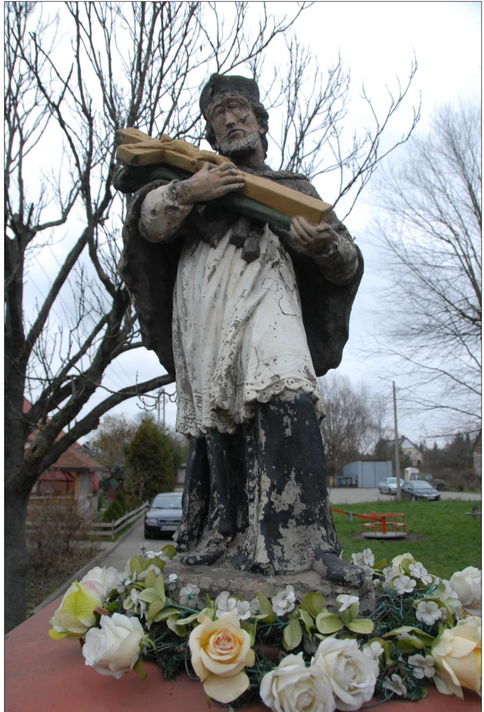
Fot. nr 3. Łochów, Al. Węgrowka, rzeźba św. Jana Nepomucena, I poł. XIX w., str. pfd., stan przed konserwacją, listopad 2022 r.