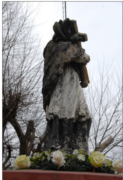
Fot. nr 13. Łochów, Al. Węgrowska, rzeźba św. Jana Nepomucena I poł. XIX w., str. zach., stan przed konserwacją, listopad 2022 r.