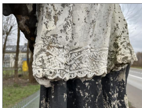
Fot. nr 23. Łochów, Al. Węgrowska, rzeźba św. Jana Nepomucena I poł. XIX w., fragment, str. zach., stan przed konserwacją, listopad 2022 r.