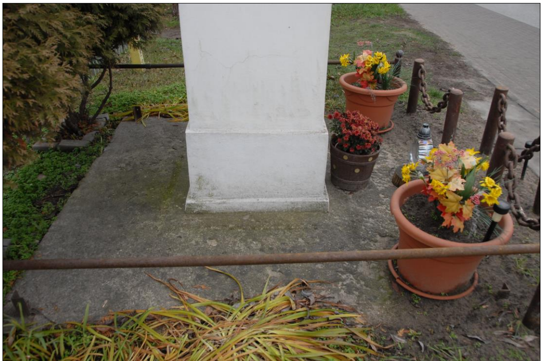
Fot. nr 5. Łochów, Al. Węgrowska, figura św. Jana Nepomucena I poł. XIX w., Fragment, str. zach., stan przed konserwacją, listopad 2022 r.