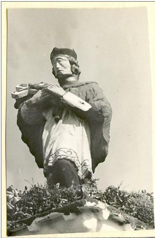
Fot. nr 1. Łochów, Al. Węgrowska, rzeźba św. Jana Nepomucena, I poł. XIX w., str. pld., stan przed konserwacją, sierpień 1967 r.