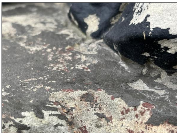
Fot. nr 20. Łochów, Al. Węgrowska, rzeźba św. Jana Nepomucena I poł. XIX w., fragment, str. płd., stan przed konserwacją, listopad 2022 r.