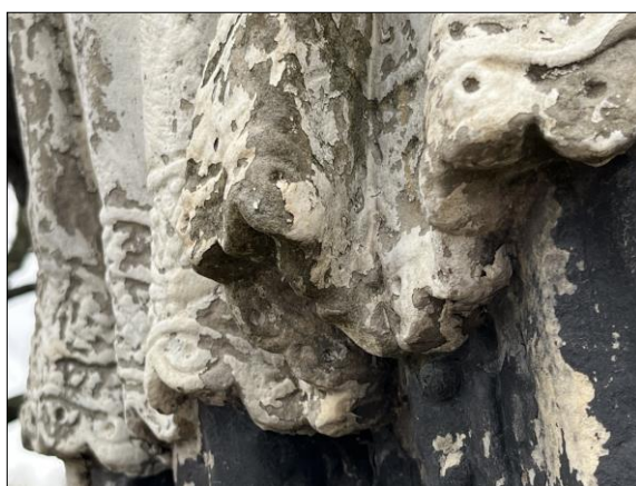
Fot. nr 25. Łochów, Al. Węgrowska, rzeźba św. Jana Nepomucena I poł. XIX w., fragment, str. płd., stan przed konserwacją, listopad 2022 r.