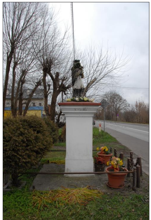
Fot. nr 9. Łochów, Al. Węgrowska, figura św. Jana Nepomucena I poł. XIX w., str. zach., stan przed konserwacją, listopad 2022 r.