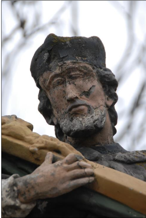
Fot. nr 14. Łochów, Al. Węgrowska, rzeźba św. Jana Nepomucena I poł. XIX w., fragment, str. płd., stan przed konserwacją, listopad 2022 r.