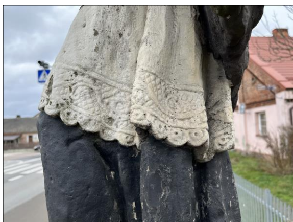
Fot. nr 22. Łochów, Al. Węgrowska, rzeźba św. Jana Nepomucena I poł. XIX w., fragment, str. wsch., stan przed konserwacją, listopad 2022 r.