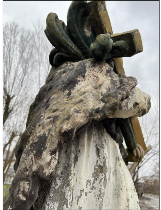
Fot. nr 15. Łochów, Al. Węgrowska, rzeźba św. Jana Nepomucena I poł. XIX w., fragment, str. zach., stan przed konserwacją, listopad 2022 r.