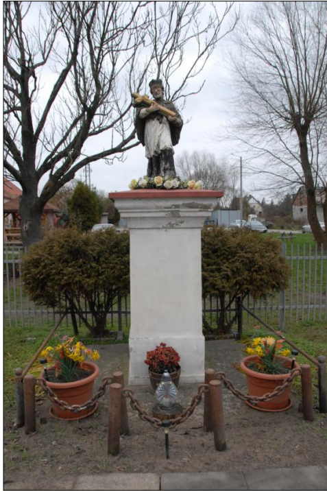
Fot. nr 6. Łochów, Al. Węgrowska, figura św. Jana Nepomucena I poł. XIX w., str. pdł., stan przed konserwacją, listopad 2022 r.