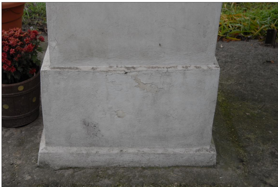
Fot. nr 30. Łochów, Al. Węgrowska, figura św. Jana Nepomucena I poł. XIX w., fragment, str. pld., stan przed konserwacją, grudzień 2022 r.