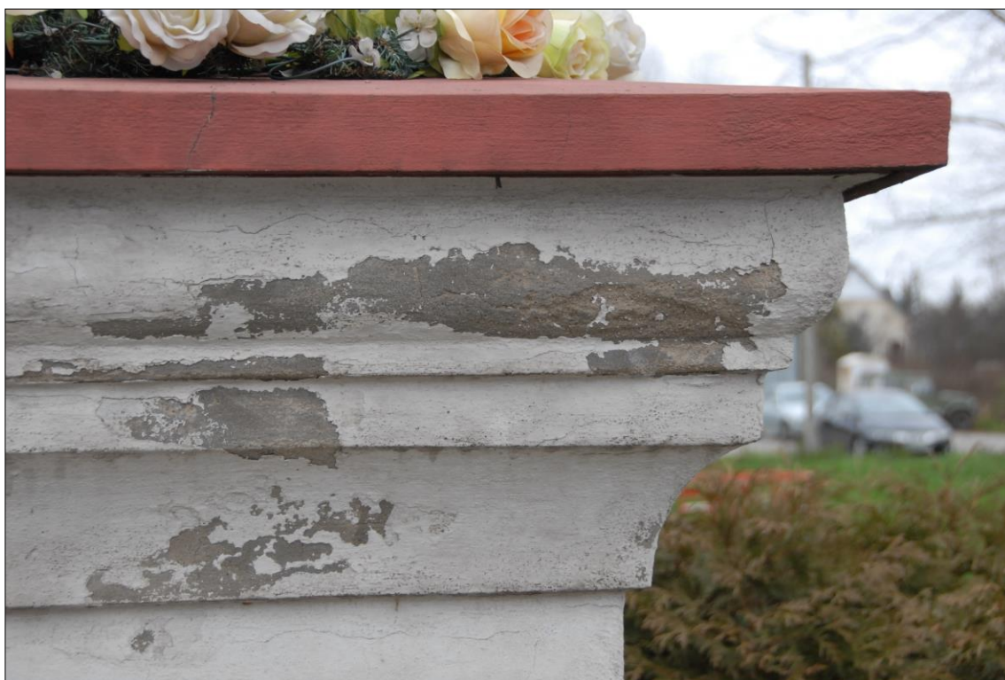
Fot. nr 28. Łochów, Al. Węgrowska, figura św. Jana Nepomucena I poł. XIX w., fragment, str. płd., stan przed konserwacją, grudzień 2022 r.