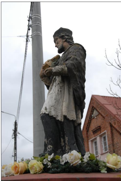
Fot. nr 12. Łochów, Al. Węgrowska, rzeźba św. Jana Nepomucena I poł. XIX w., str. wsch., stan przed konserwacją, listopad 2022 r.