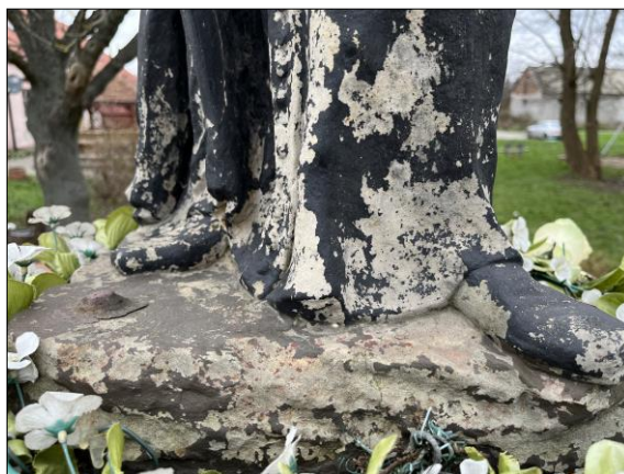
Fot. nr 21. Łochów, Al. Węgrowska, rzeźba św. Jana Nepomucena I poł. XIX w., fragment, str. płd., stan przed konserwacją, listopad 2022 r.