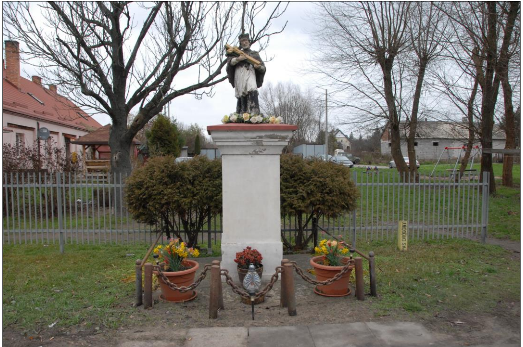
Fot. nr 4. Łochów, Al. Węgrowska, figura św. Jana Nepomucena I poł. XIX w., str. pld., stan przed konserwacją, listopad 2022 r.