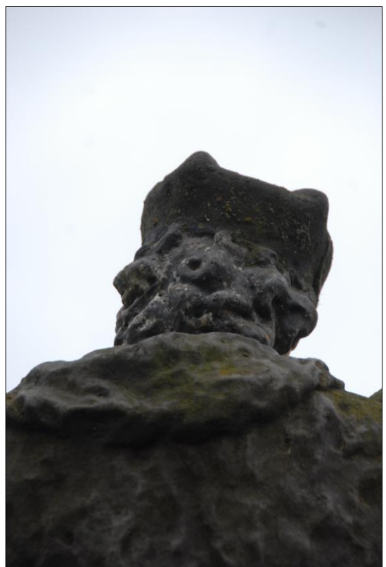
Fot. nr 17. Łochów, Al. Węgrowska, rzeźba św. Jana Nepomucena I poł. XIX w., fragment, str. półn., stan przed konserwacją, listopad 2022 r.