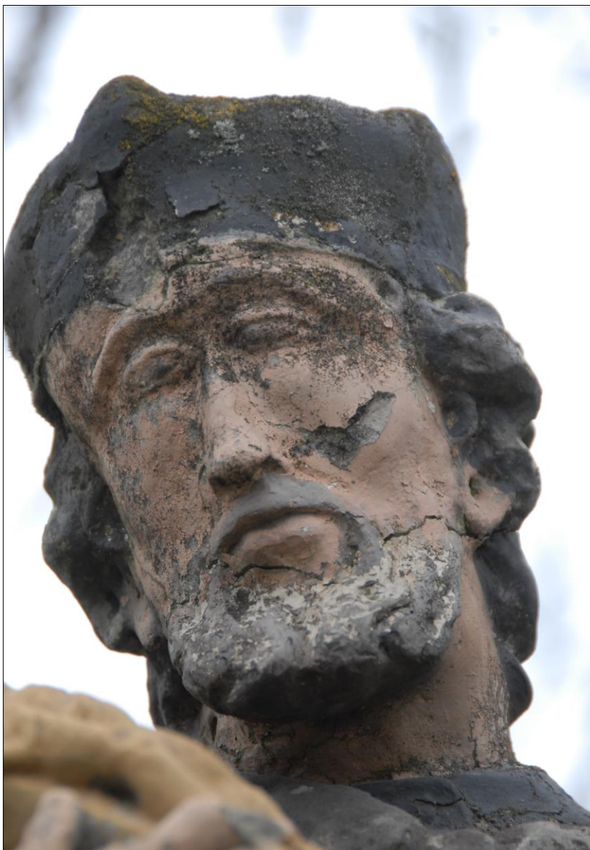
Fot. nr 18. Łochów, Al. Węgrowska, rzeźba św. Jana Nepomucena I poł. XIX w., fragment, str. pld., stan przed konserwacją, grudzień 2022 r.