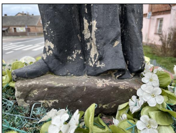
Fot. nr 24. Łochów, Al. Węgrowska, rzeźba św. Jana Nepomucena I poł. XIX w., fragment, str. wsch., stan przed konserwacją, listopad 2022 r.