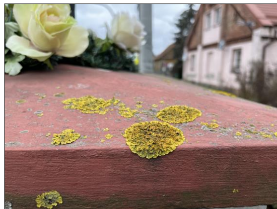
Fot. nr 27. Łochów, Al. Węgrowska, figura św. Jana Nepomucena I poł. XIX w., fragment, str. płd., stan przed konserwacją, listopad 2022 r.