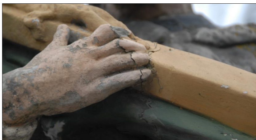
Fot. nr 19. Łochów, Al. Węgrowska, rzeźba św. Jana Nepomucena I poł. XIX w., fragment, str. pld., stan przed konserwacją, grudzień 2022 r.