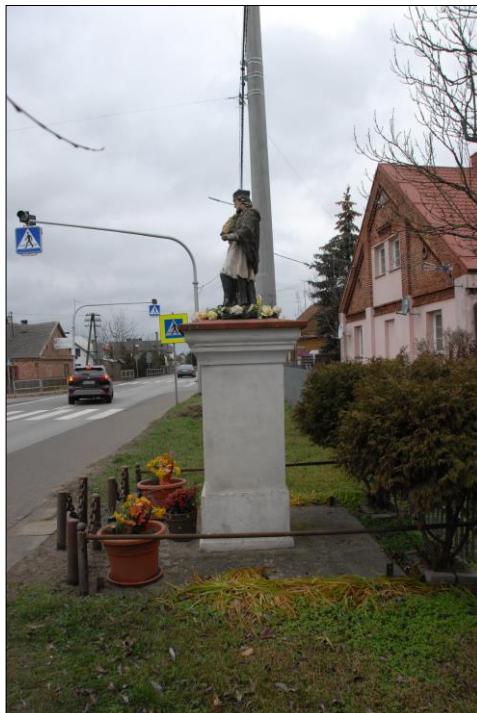
Fot. nr 8. Łochów, Al. Węgrowska, figura św. Jana Nepomucena I poł. XIX w., str. wsch., stan przed konserwacją, listopad 2022 r.