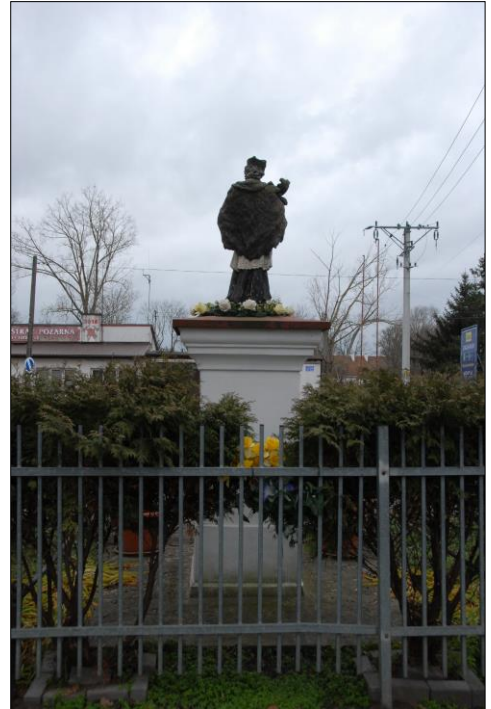
Fot. nr 7. Łochów, Al. Węgrowska, figura św. Jana Nepomucena I poł. XIX w., str. półn., stan przed konserwacją, listopad 2022 r.