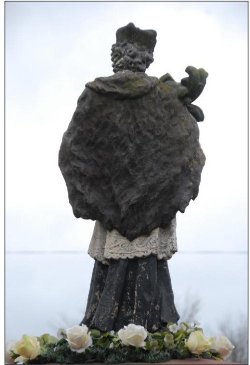
Fot. nr 11. Łochów, Al. Węgrowska, rzeźba św. Jana Nepomucena I poł. XIX w., str. ptn., stan przed konserwacją, listopad 2022 r.