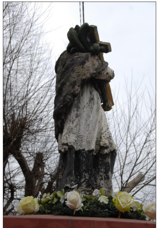
Fot. nr 13. Łochów, Al. Węgrowska, rzeźba św. Jana Nepomucena I poł. XIX w., str. zach., stan przed konserwacją, listopad 2022 r.