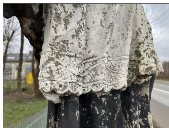
Fot. nr 23. Łochów, Al. Węgrowska, rzeźba św. Jana Nepomucena I poł. XIX w., fragment, str. zach., stan przed konserwacją, listopad 2022 r.