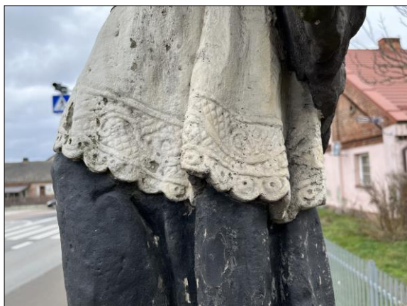
Fot. nr 22. Łochów, Al. Węgrowska, rzeźba św. Jana Nepomucena I poł. XIX w., fragment, str. wsch., stan przed konserwacją, listopad 2022 r.