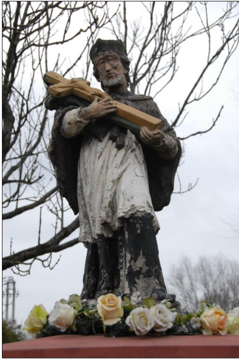
Fot. nr 10. Łochów, Al. Węgrowska, rzeźba św. Jana Nepomucena I poł. XIX w., str. pld., stan przed konserwacją, listopad 2022 r.