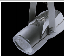
REFLEKTORY SNOPOWE OŚWIELAJĄCE ZABYTKOWĄ KONSTRUKCJĘ DACHU