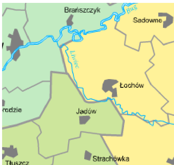
Rysunek 1. Obszar objęty strategią

Dolina Liwca charakteryzuje się znaczną unikalnością, nie tylko z uwagi na bogactwo naturalne i bogate dziedzictwo kulturowe, ale i bliskość Warszawy. Strategia pokazuje więc, w jaki sposób efektywnie wykorzystywać atuty obszaru i przyciągać coraz większą liczbę turystów, a jednocześnie wyeliminować jego słabe strony i unikać zagrożeń. Może być też doskonałym źródłem informacji dla potencjalnych inwestorów, planujących swoje przedsięwzięcia w branży turystycznej. Strategia przestrzennie obejmuje teren dwóch gmin, dla których Liwiec jest rzeką graniczną.